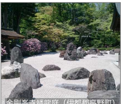
金剛峯寺蟠龍庭 (伊都郡高野町)