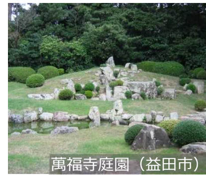
萬福寺庭園 (益田市)