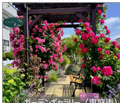
ガーデンギャラリー (恵庭市)