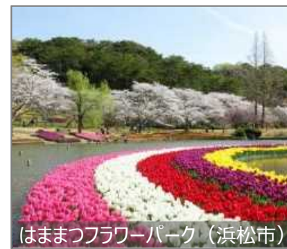
はままつフラワーパーク (浜松市)