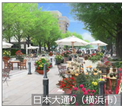
日本大通り (横浜市)