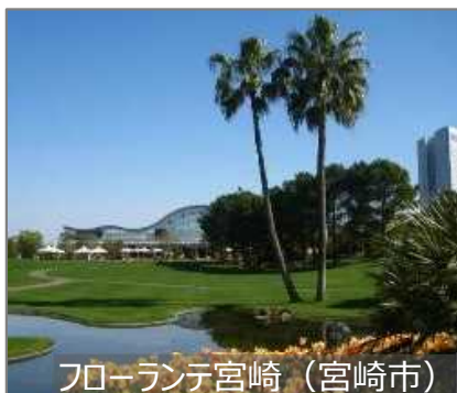
フローランテ宮崎 (宮崎市)