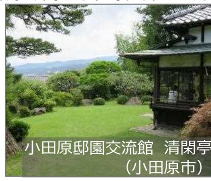
小田原邸園交流館 清閑亭 (小田原市)