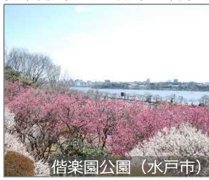
偕楽園公園 (水戸市)