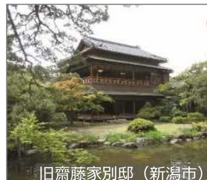
旧齋藤家別邸 (新潟市)