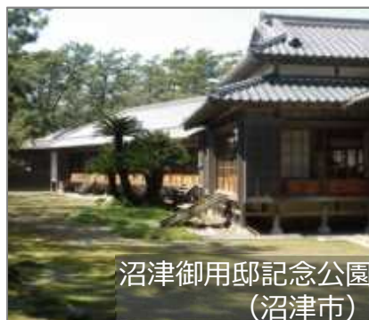
沼津御用邸記念公園 (沼津市)