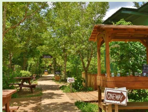
三富今昔村(三芳町)

日本農業遺産に認定された平地林、屋敷、畑が連なる江戸時代より続く風景の中で、雑木林の中を駆け回り、芋を掘り、環境を学ぶ。里山・農・花を巡る小さな旅。