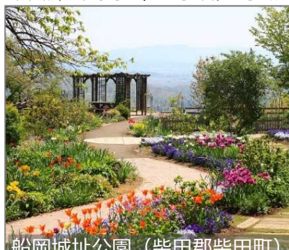
船岡城址公園 (柴田郡柴田町)