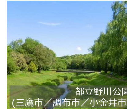
都立野川公園 (三鷹市/調布市/小金井市)