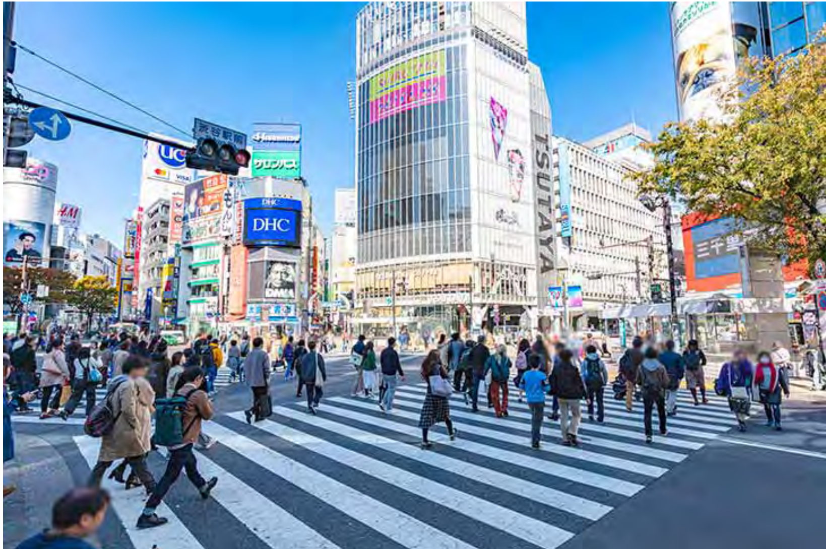
渋谷 スクランブル交差点