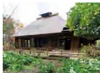
⑬調布市武者小路実篤公園・記念館