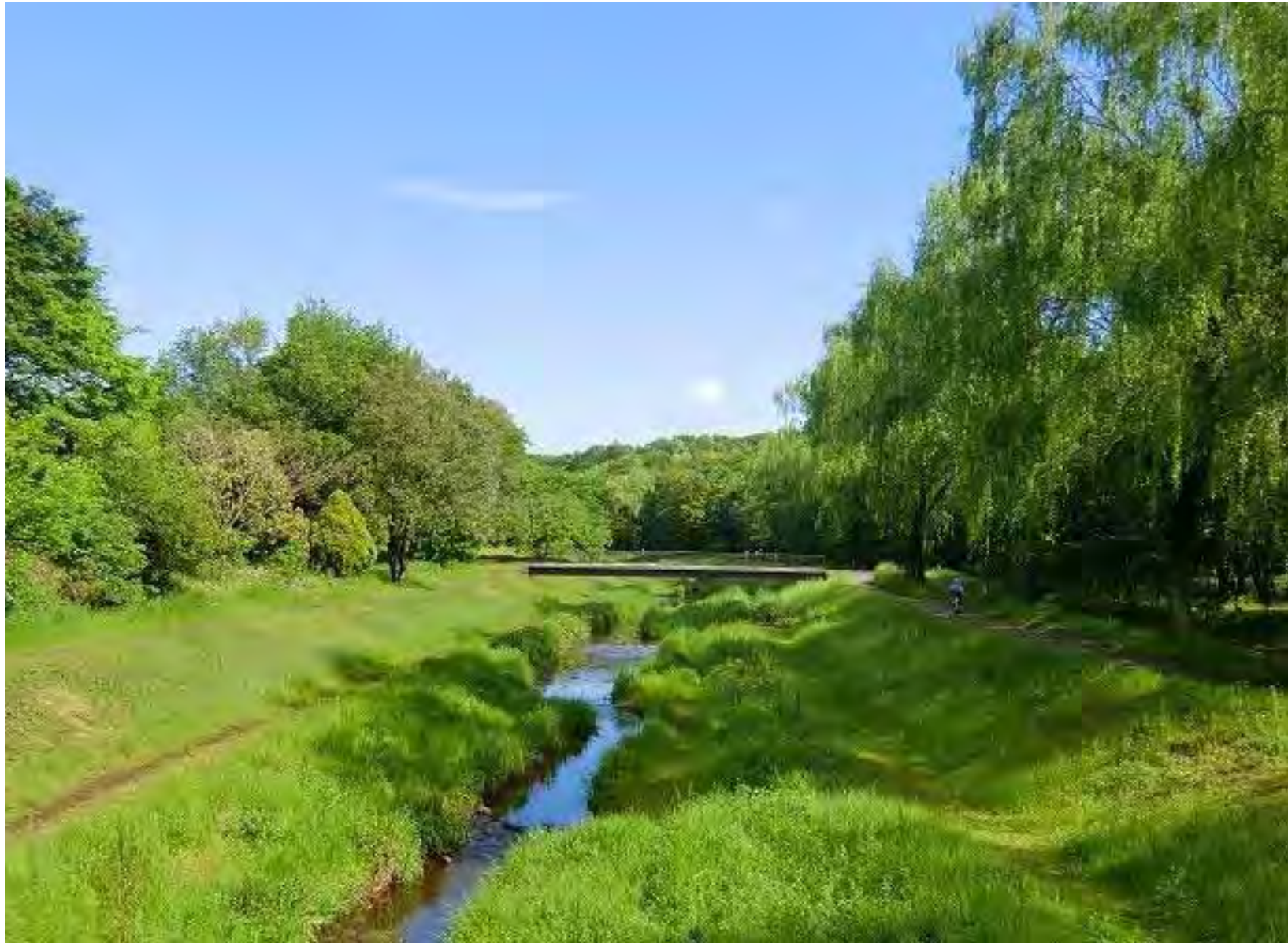
都立野川公園（野川遊歩道）