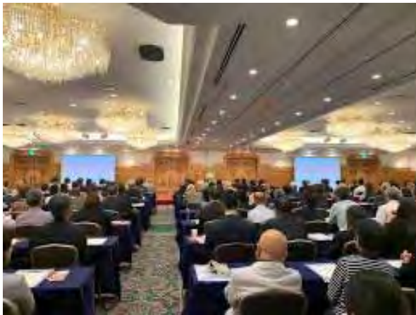
2019年10月シンポジウム（238名参加）