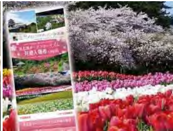
2020年3月 共通入場券販売開始