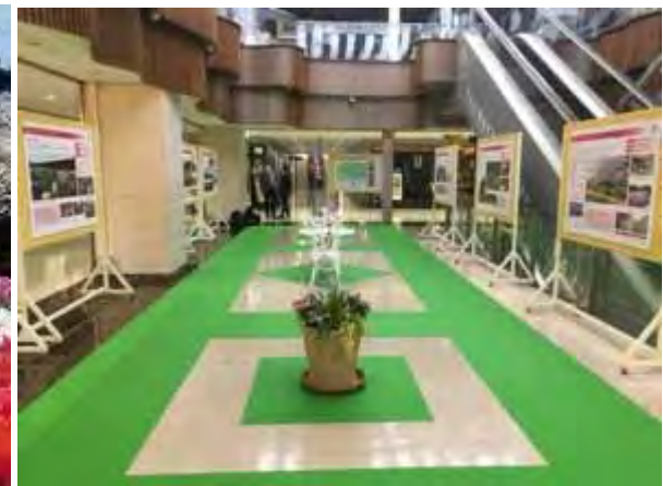
2021年1月 百貨店へのブース出展